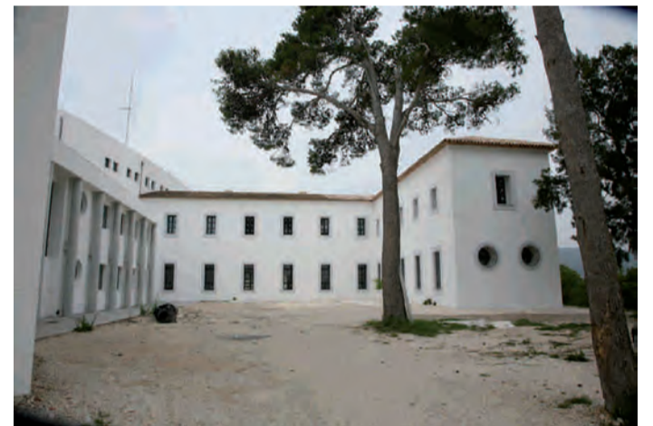
Seu musical per a Cor i Banda