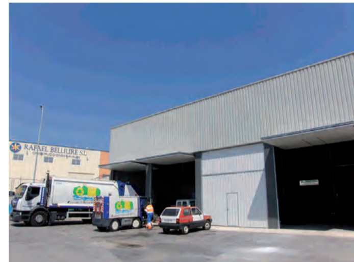
Noves Instal.lacions Benissa Impuls

Solidaritat, responsabilitat, transparència, austeritat i diàleg són els nostres principis.