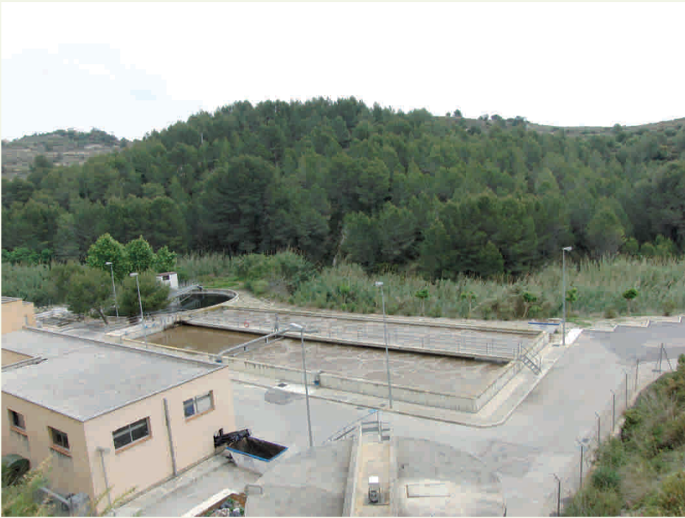
Reutilització de les aigües de la Depuradora