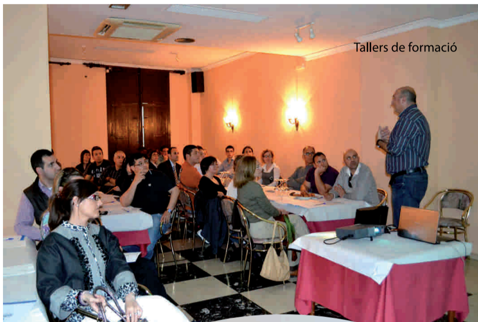
Tallers de formació