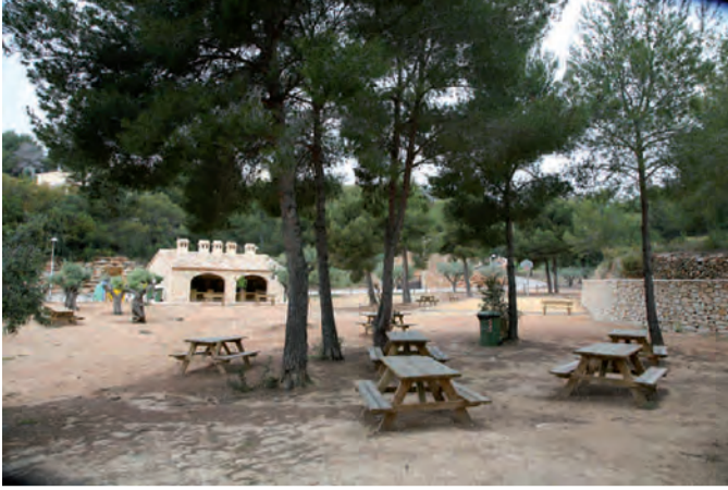
Zona d'oci Magraner