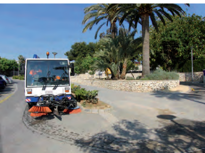
Adquisició d'agradadora zona costera

Solidaridad, responsabilidad, transparencia, austeridad y diálogo son nuestros principios.