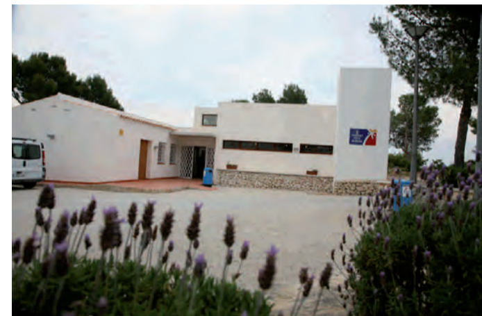
Futura OAC zona costera