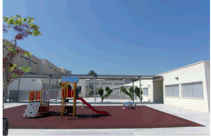
Nou Col·legi Manuel Bru

En estos últimos años de gobierno municipal del Partido Popular se han hecho muchas cosas en Benissa, gracias a ti y a la confianza que nos has dado. No hace falta que te las contemos todas, porque las conoces y se pueden ver.