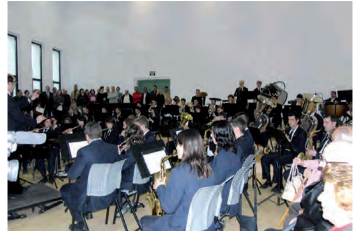
Seu musical per a Cor i Banda