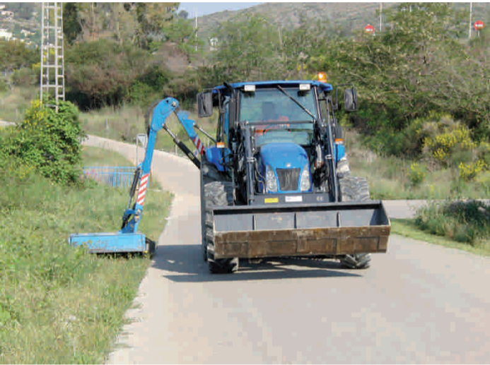
Adquisició màquina desbrossadora