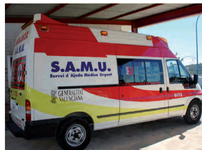
Nova unitat SAMU

El Partido Popular de Benissa ha reducido en un 50% los gastos de esta campaña electoral y destinará 3.000 Euros a Cáritas Parroquial Benissa