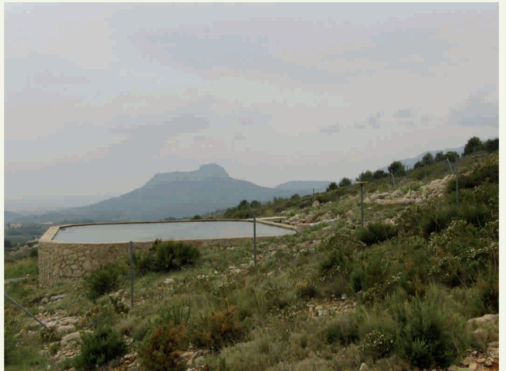
Projecte de reforestació i prevenció d'incendis en la Solana

Conservar nuestro entorno es la mejor herencia que podemos dejar a nuestros hijos.