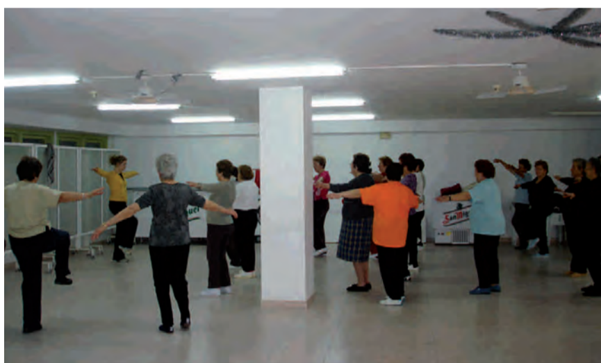
Activitats Centre Social Bèrnia