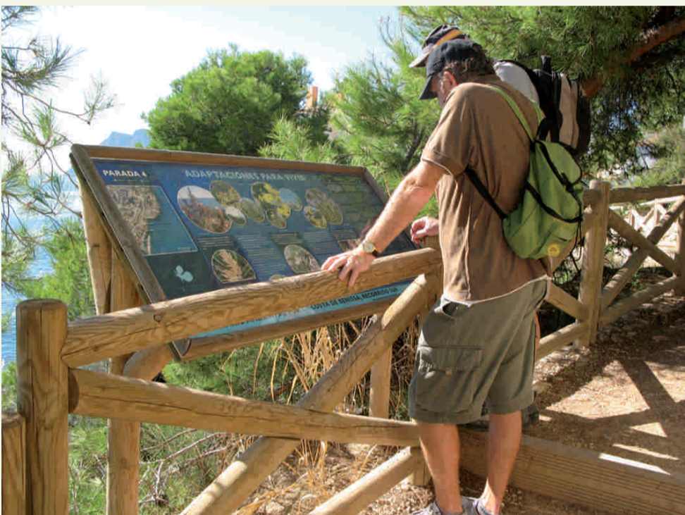
Recuperació ambiental Passeig Ecològic