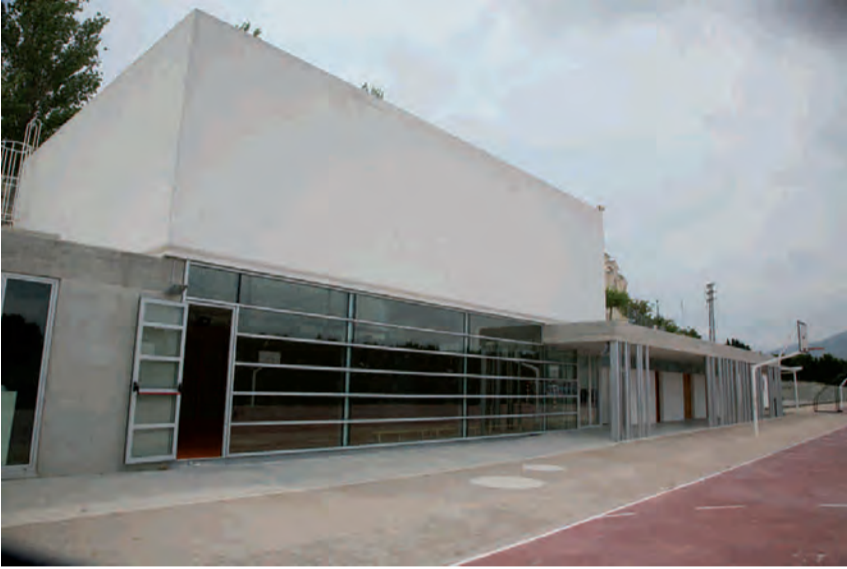
Gimnàs C.P. Padre Melchor