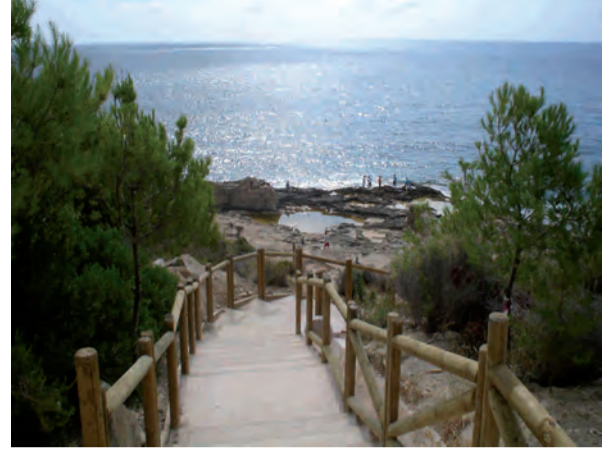
Passeig Ecològic Litoral