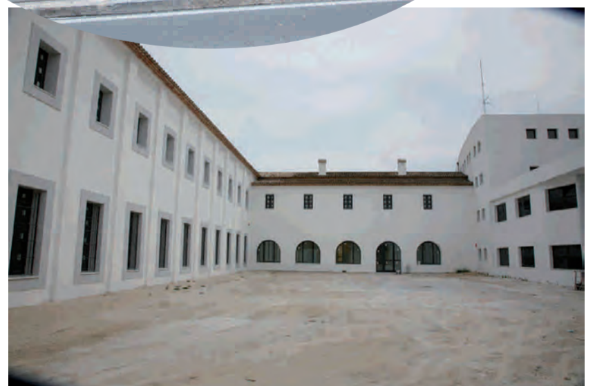
Centre Noves Tecnologies. Seminari Franciscà