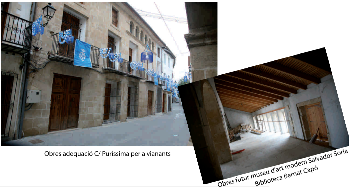
Obres adequació C/ Puríssima per a vianants