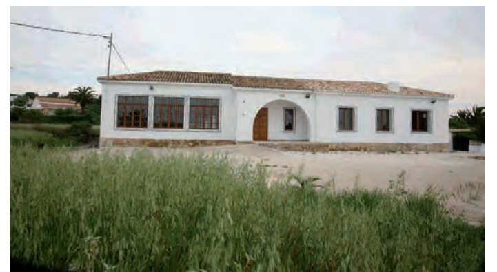
Rehabilitació Escoles Pedramala