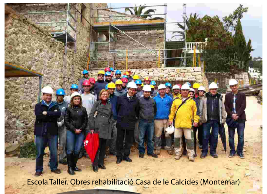
Escola Taller. Obres rehabilitació Casa de le Calcides (Montemar)