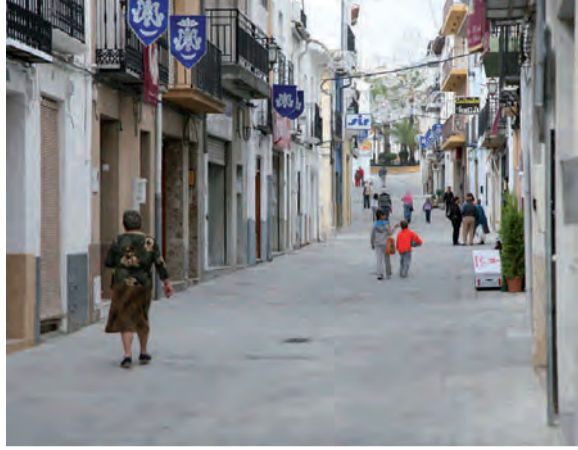
Obres adequació C/ Sant Nicolau per a vianants