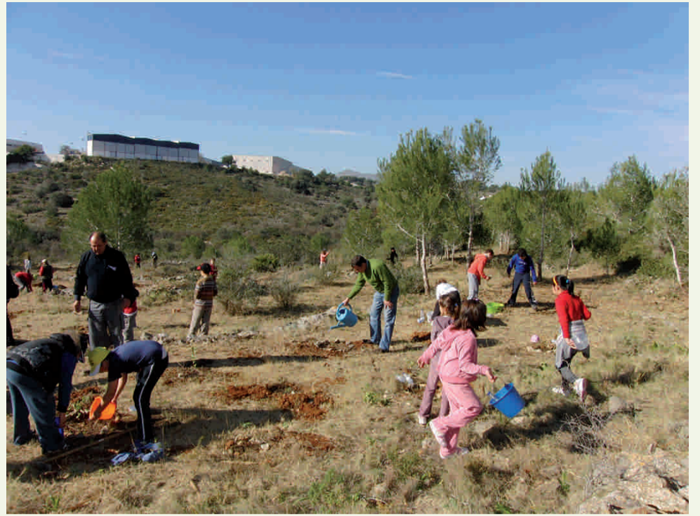
Dia de l'Arbre