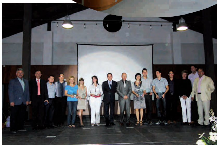
Premis Benissa és Qualitat