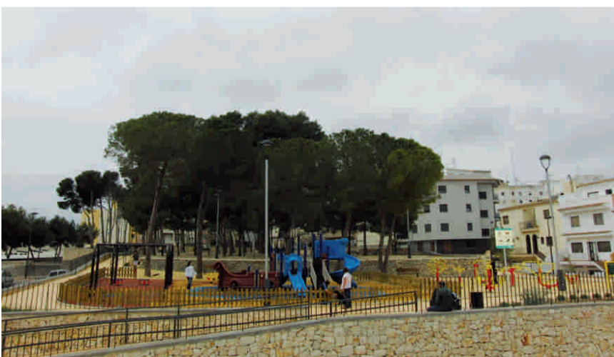
Parc Infantil Pinada de Selva