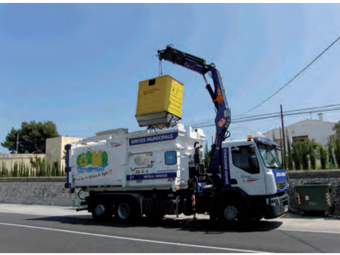
Nou vehicle per a la recollida selectiva de residus