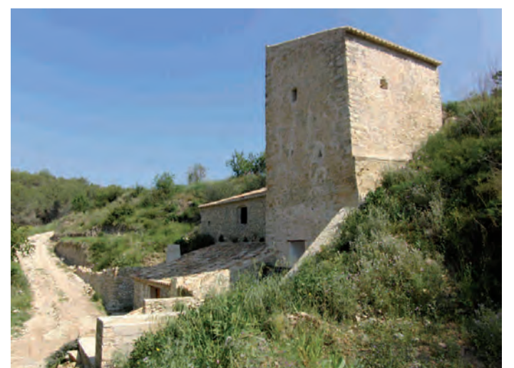
Molí del Quisi