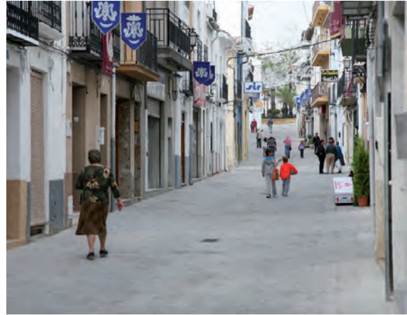
Obres adequació C/ Sant Nicolau per a vianants