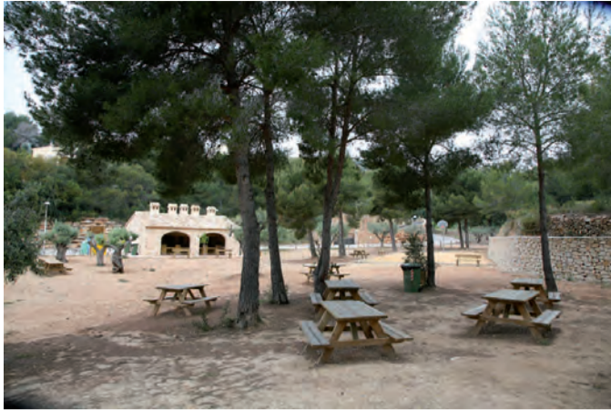
Zona d'oci Magraner