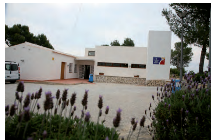
Futura OAC zona costera