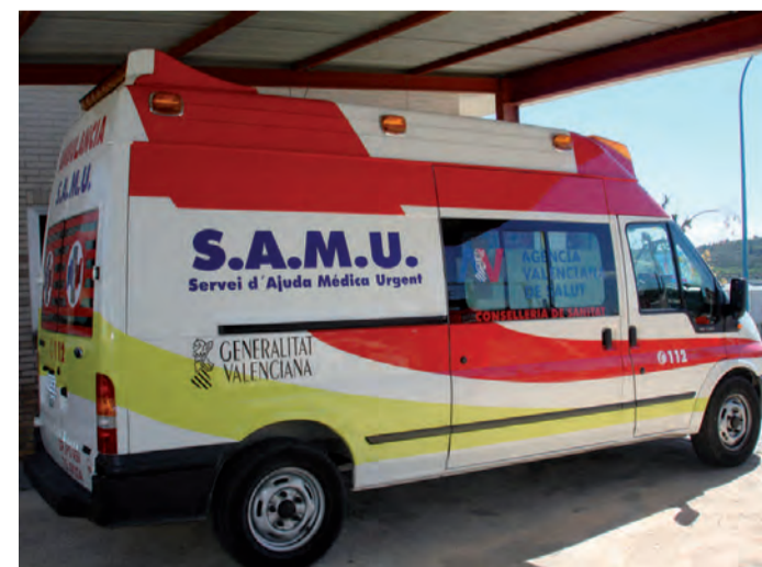
Nova unitat SAMU

Benissa's Partido Popular has reduced the cost of this campaign by 50% and will donate 3.000 euros to the charity "Cáritas Parroquial Benissa".