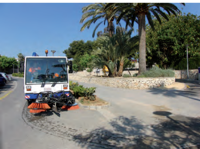
Adquisició d'agradadora zona costera

Solidarity, responsibility, transparency, austerity and dialogue are our principals.