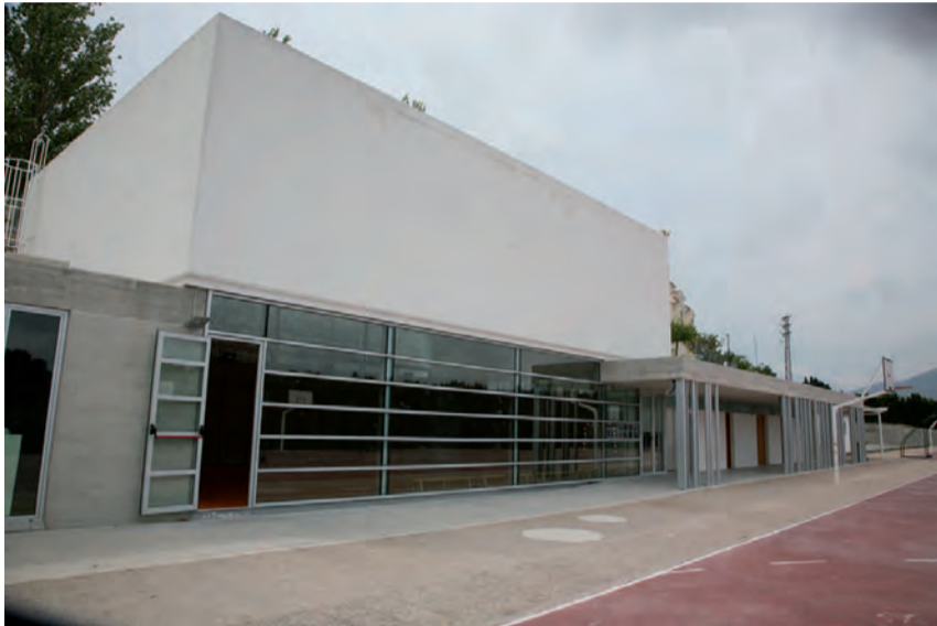
Gimnàs C.P. Padre Melchor