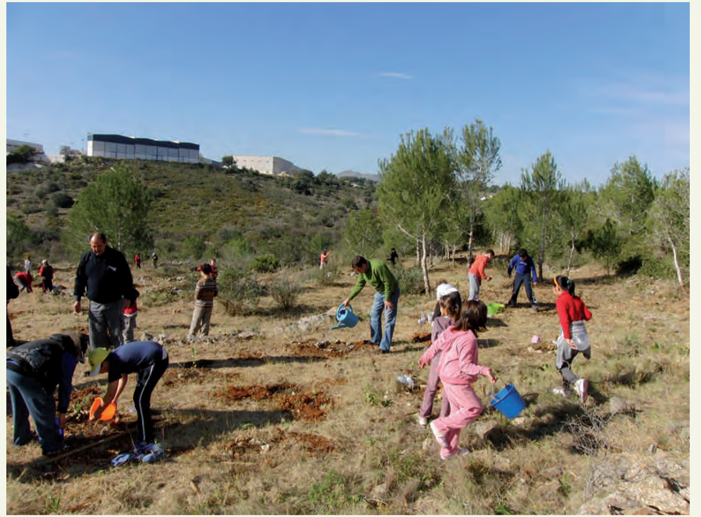
Dia de l'Arbre