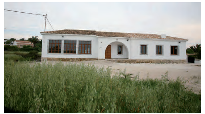
Rehabilitació Escoles Pedramala