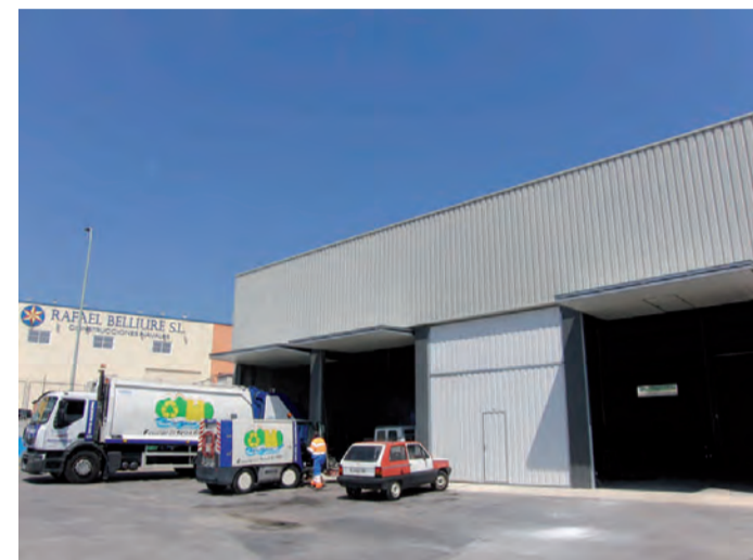
Noves Instal.lacions Benissa Impuls

Solidarität, Verantwortungsbewusstsein, Transparenz, Sparsamkeit und Dialog sind unsere Prinzipien.