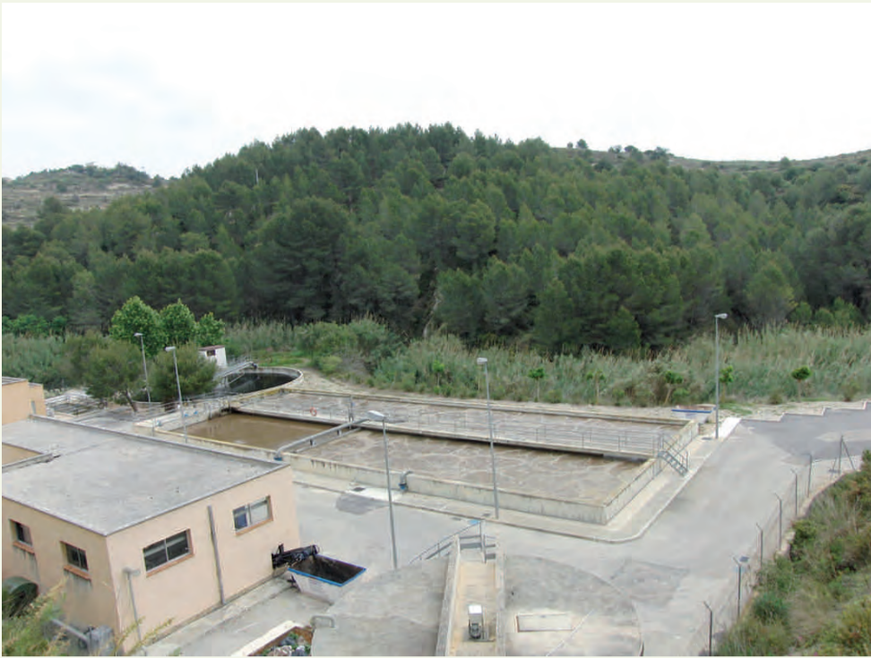
Reutilització de les aigües de la Depuradora