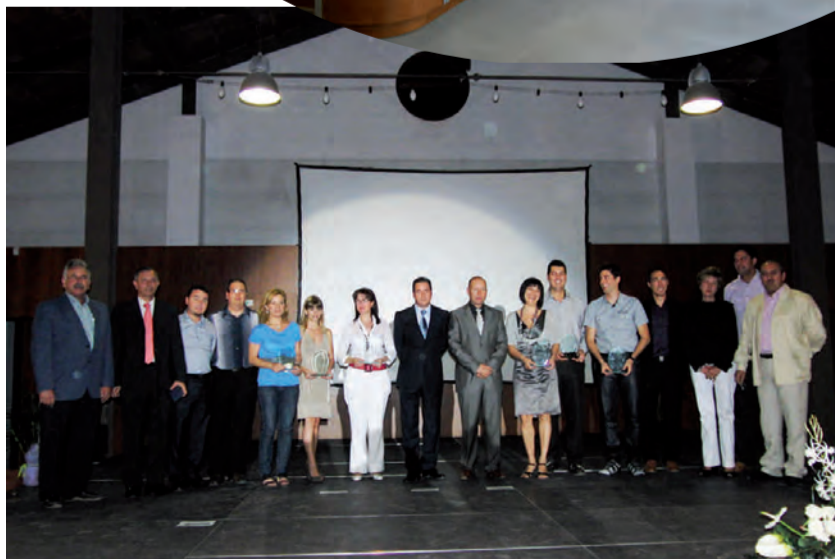
Premis Benissa és Qualitat