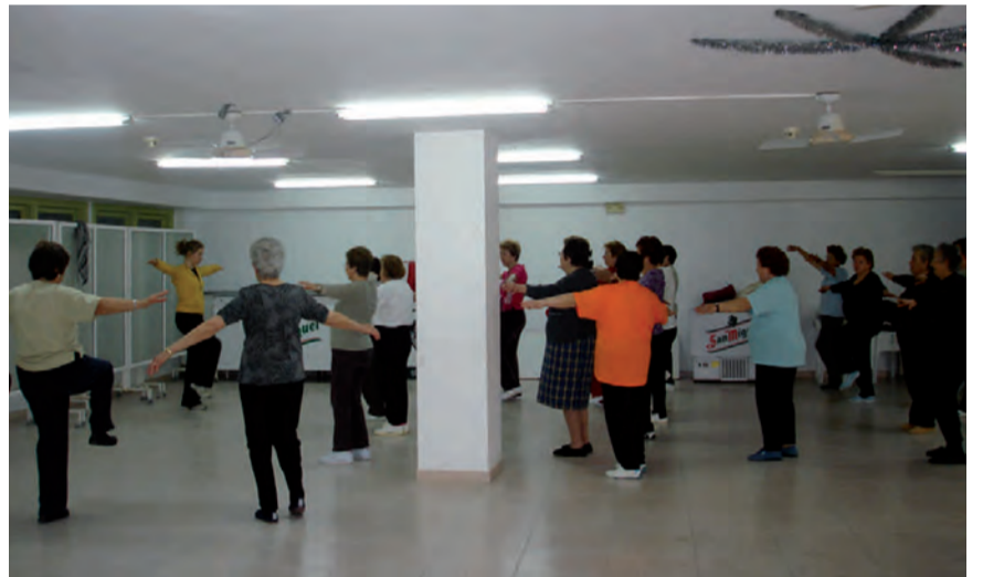
Activitats Centre Social Bèrnia