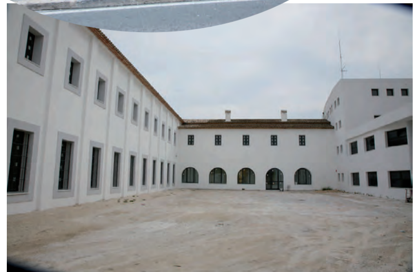
Centre Noves Tecnologies. Seminari Franciscà