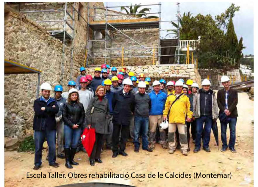
Escola Taller. Obres rehabilitació Casa de le Calcides (Montemar)