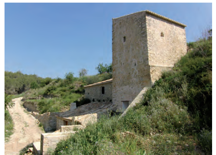
Molí del Quisi

"Ein Volk muss seine Vergangenheit zurückgewinnen und in seine Zukunft investieren"