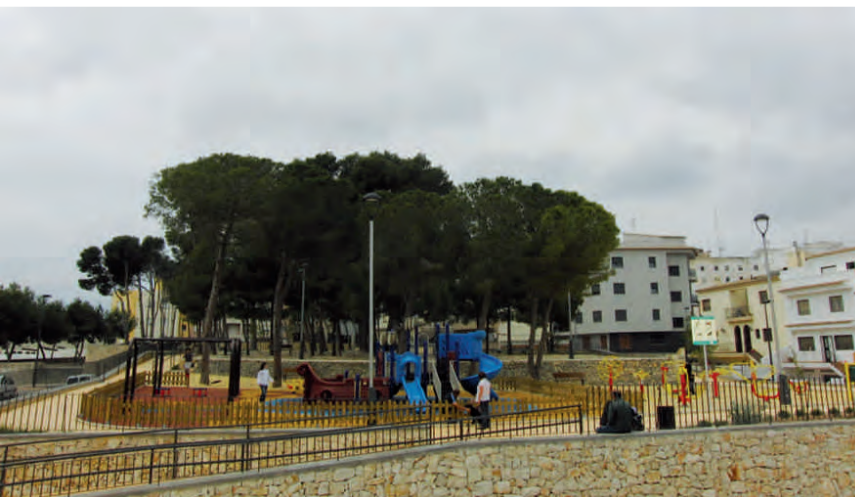
Parc Infantil Pinada de Selva