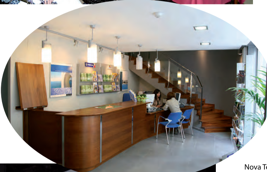
Nova Tourist Info