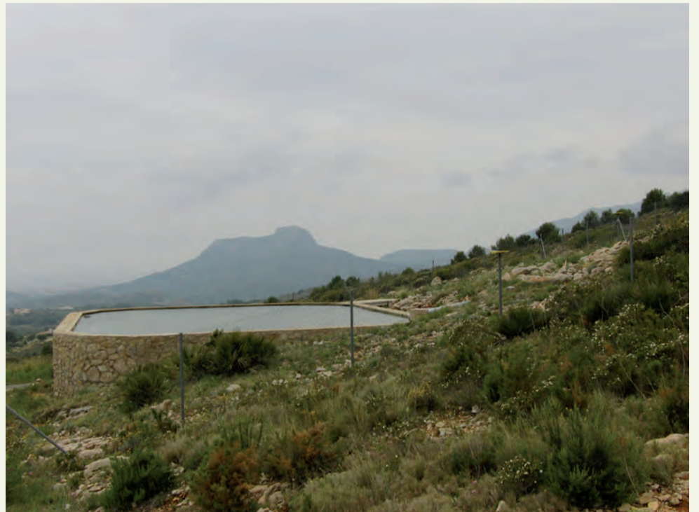
Projecte de reforestació i prevenció d'incendis en la Solana

The conservation of our environment is the best heritage we can leave our town.