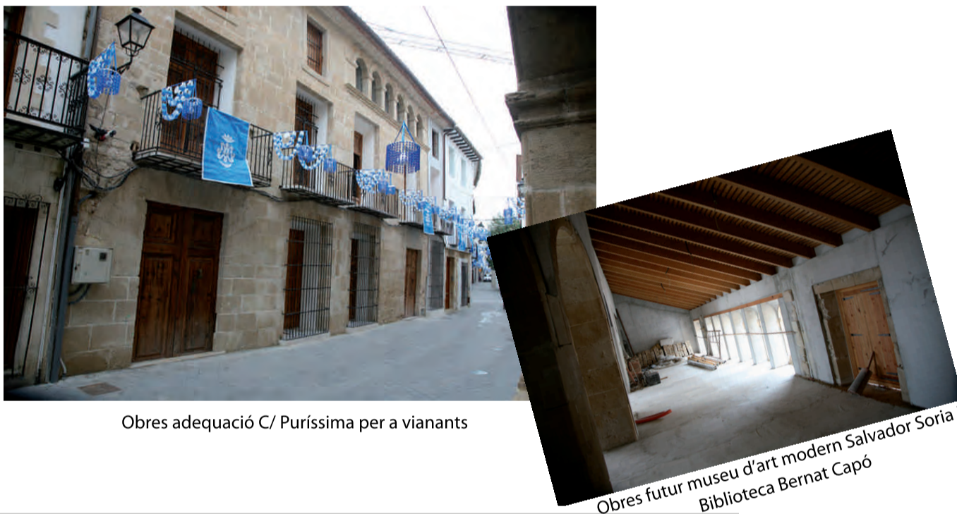
Obres adequació C/ Puríssima per a vianants