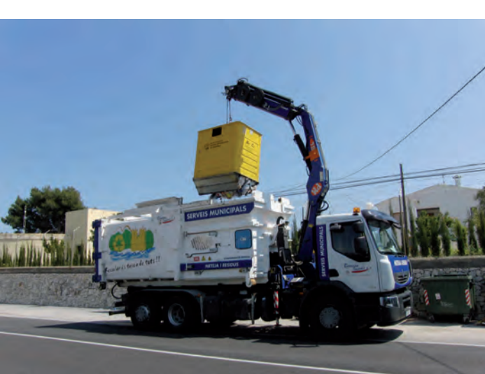
Nou vehicle per a la recollida selectiva de residus