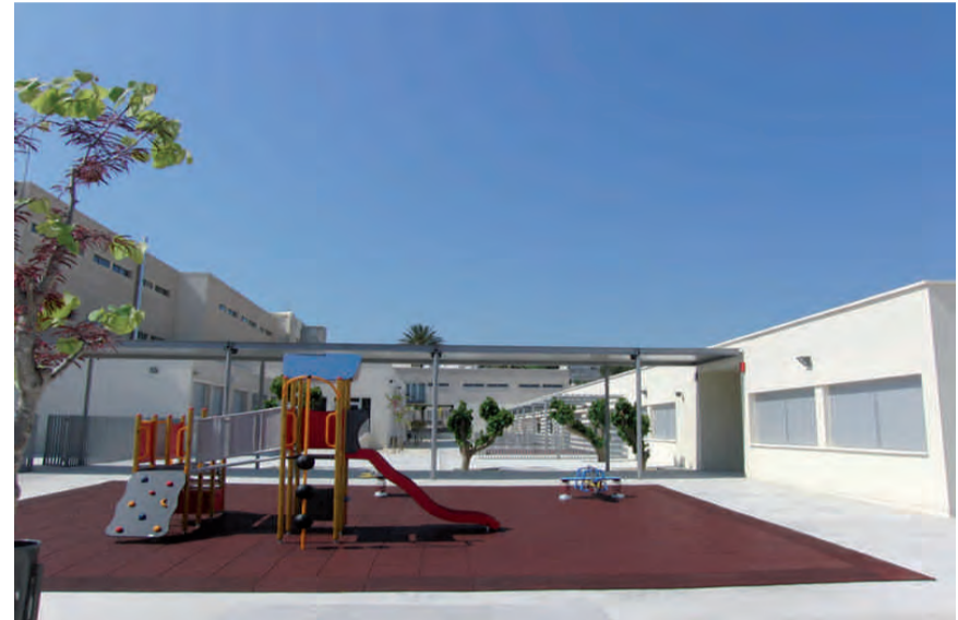
Nou Col·legi Manuel Bru

During these last years in government on the local council "Partido Popular" (Popular Party) has delivered great achievements in Benissa thanks to your support and the trust you have put in us. It's not necessary to list all our actions and achievements since these are more than evident.