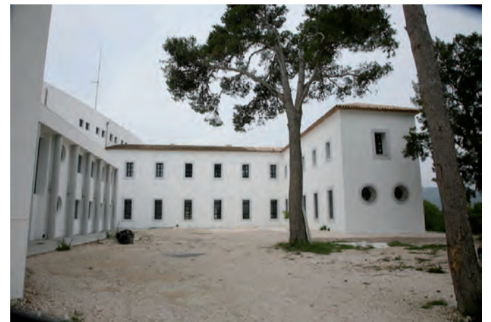
Seu musical per a Cor i Banda