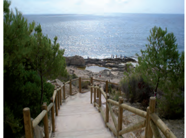
Passeig Ecològic Litoral