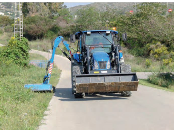
Adquisició màquina desbrossadora